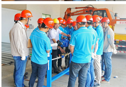
在施工一线,以更大的热情投入到技改创新中,为江南水务的发展添砖加瓦!”