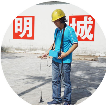
▲夏季是管网负荷最高的时候，为了减少管网漏损，及时消除爆管隐患，在高峰供水期间，检测员更是一刻不松，带着厚重的隔音耳机，挂着声呐扩音器，行走在管网生命线上，顾不得烈日当头，热浪滚滚，静静地倾听流水声，细细地“诊断”。