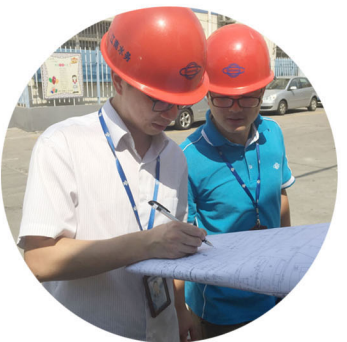
▲在我们的印象中设计所的员工应该是想象中的“白领范儿”，可事实并非如此，在农村，地形复杂，居民住宅无规则地分布在各个角落，设计师需要现场勘测测量，管道到哪，他们就走到哪，为了摸清用户的内部管道，钻进脏兮兮的鸡棚。在建筑工地，他们踩着脚手架，坐着临时电梯到几十层的工地楼顶；打着手电进入到黑暗的地下室。他们忍受着高温“烤”验，汗水浸透衣衫，他们却依然坚守岗位，用汗水划出一道“生命线”。