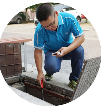
▲一把钩子，一个背包，一辆电瓶车，这就是抄收员的标配。为了避开高温时段，我们的抄收员一大早就开始穿梭在城市的大街小巷，或是在蚊虫乱飞的草丛中寻找表位，或是在烈日下掰开几十斤重的表盖……热了，擦擦汗；累了，坐一会。