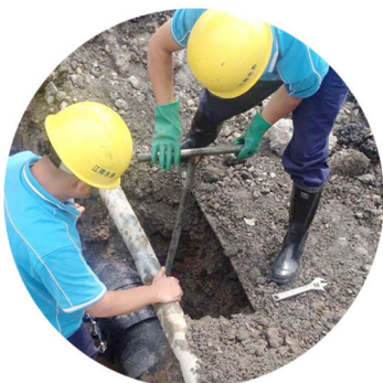
▲每年7月到9月是我市用水量最大、最高峰的时期，市政工程公司抢修

患。同时，针对夏季天气的特点，扎实做好防暑、防雷、防汛、防台等工作，杜绝一切事故的发生。为确保夏季用水安全，进一步强化水质检测工作，坚持“不合格的水不出厂、不达标的水不进管网”，实行对原水、工艺过程水、管网及末梢水的全程监控；加固、保养和更换取水头部的浮标、围油栏等保护设施；强化原水在线实时监测，健全与市疾控中心、环境监测站的联合监测网络，实现信息互通、资源共享。为确保水源地安全，各水厂进一步加大值班巡视力度，密切监视水厂和水源地保护区，提高预警水平，同时备足备全吸油毡、粉末活性炭等应急物资，加强与有关部门、长江上下游水司的沟通联系，积极开展应对水质突发事件的演习、演练活动，有效提高应急处置能力。此外，公司还着力做好“澄水热线”和“抢修热线”的接处工作，保证服务、抢修的及时率，全力为广大市民营造安全优质的饮用水环境。