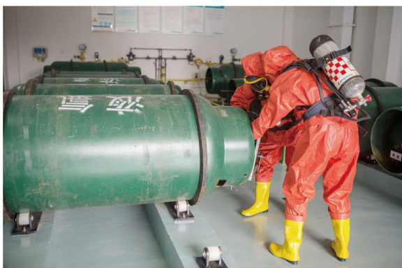
通过此次演练,应急指挥水平、处置能力、安全用氯意识都有了较好提升,为今后快速、有效地处置突发事件奠定了坚实基础。(澄水)

本报讯 为加强职工安全用氯意识,提高应急处置水平,近日,肖山、小湾、澄西水厂分别组织班组长员工开展了氯气泄漏应急演练。 “滴、滴、滴……”漏氯报警响起,参演人员两人一组,迅速穿上防护服,佩戴呼吸器,拿上应急堵漏专用工具进入氯库。同时,值班人员打开氯库排风扇,确认中和装置运行正常。待确认 泄漏位置后,参演人员即刻选用专用堵漏堵漏工具进行堵漏。整个过程由水厂安全员对防护装备穿戴、漏点判断、堵漏工具应用、应急处置时间等进行打分。演练结束后,安全员亲自上阵,针对演练过程中发现的细节问题,进行了示范讲解,让每一位参演人员熟练掌握器具操作要领,沉着应对。