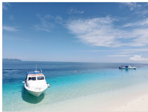
海天一色