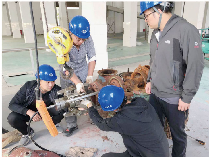
“水封环是哪个?叶轮的转动方向在哪边?”10月26日,制水保障中心组织新员工开展了水泵维保专项培训,让新员工在实践中熟悉水泵结构,掌握基本拆装技巧,尽快地胜任岗位工作。