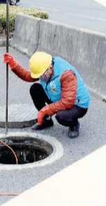
⑤2月6日，由公司青年志愿者组成的青年先锋队联合养护人员对辖区内医院、医疗设施生产等单位周边的供排水设施进行逐一排查。