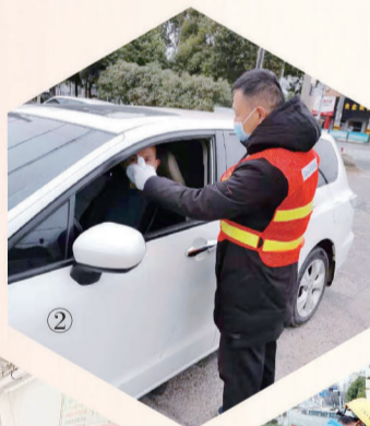
②青年志愿者在澄杨路周西路路口执勤。