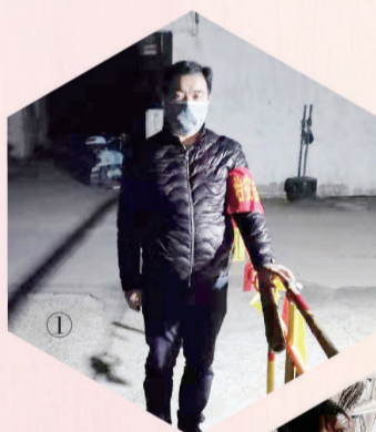
①青年志愿者在华士镇勤丰村18队村路口彻夜执勤。

一个支部就是一座堡垒，一个党员就是一面旗帜。1月28日，中共江阴市委组织部紧急动员全市党员参与江阴市各交通管控点防控工作，征集志愿者作为后备力量。公司党委接到通知后，及时传达、积极响应，20名党员主动请缨加入到疫情阻击战中。