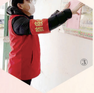
③青年志愿者在社区张贴疫情防控宣传单。

党旗所指就是团旗所向，公司团委积极响应公司党委疫情防控相关工作要求，号召汇聚青春力量，助力打赢疫情防控阻击战。公司青年志愿者自告奋勇参与到社区、村镇等基层疫情防控工作中。